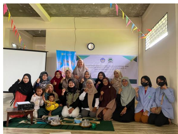
Gambar 2 Dokumentasi Kegiatan