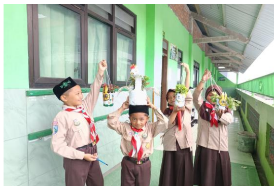
Gambar 3 Hasil Eco - Planter

Eco-planter yang telah dibuat dimanfaatkan dalam kegiatan praktik penanaman dan penghijauan di lingkungan sekolah. Pendampingan difokuskan pada pemanfaatan Eco-planter sebagai media tanam tanaman hias dan tanaman hijau yang mudah dirawat. Hasil kegiatan menunjukkan bahwa siswa mulai memahami keterkaitan antara pengelolaan sampah, pelestarian lingkungan, dan keberlangsungan kehidupan tumbuhan. Eco-planter tidak hanya berfungsi sebagai hasil karya daur ulang, tetapi juga sebagai sarana pembelajaran kontekstual, khususnya pada mata pelajaran IPA yang berkaitan dengan pertumbuhan tanaman dan proses fotosintesis.