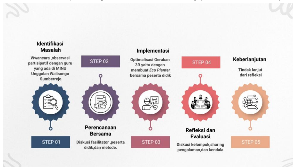
Gambar 1. Tahapan Pelaksanaan Pengabdian kepada Masyarakat

Metode pengabdian ini menggunakan pendekatan Participatory Action Research (PAR) yang menekankan keterlibatan aktif seluruh warga sekolah, khususnya guru dan siswa MINU Unggulan Wali Songo Sumberrejo, dalam setiap tahapan kegiatan. Pendekatan PAR dipilih karena memungkinkan terjadinya proses pembelajaran yang kolaboratif, reflektif, dan berkelanjutan dalam upaya mengoptimalkan gerakan 3R (Reduce, Reuse, Recycle) melalui pemanfaatan limbah menjadi Eco-planter berbasis daur ulang (Elda Felani et al. 2025).