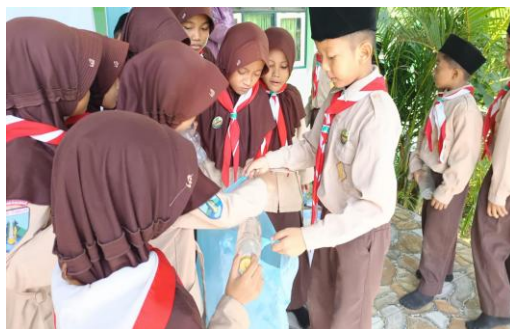
Gambar 2 Praktik Pemilahan bahan

Tahap berikutnya berupa pelatihan teknis pembuatan Eco-planter dengan memanfaatkan botol plastik bekas sebagai bahan utama.(Manalu et al. 2025) Pada tahap ini, peserta memperoleh pendampingan langsung terkait teknik pemilahan bahan, proses pembersihan, perancangan desain, serta langkah-langkah pembuatan Eco-planter yang aman, fungsional, dan memiliki nilai estetika. Hasil pendampingan menunjukkan bahwa peserta mampu menghasilkan Eco-planter berbasis daur ulang yang layak digunakan sebagai media tanam. Selain itu, kegiatan ini mendorong berkembangnya kreativitas siswa dalam memodifikasi bentuk dan tampilan Eco-planter sesuai dengan ide dan imajinasi mereka, sehingga produk yang dihasilkan memiliki variasi desain yang beragam.(Wulandari and Fachrizal 2023)